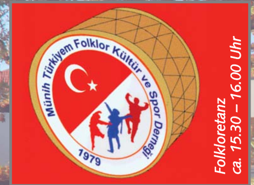
Folkloretanz ca. 15.30 – 16.00 Uhr

sowie Türkei-Quiz, Kaffeesatzlesen und Produkte unserer Werkstätten im türkischen Bazar