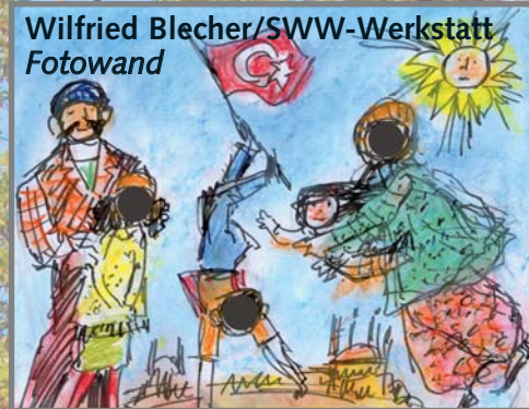
Wilfried Blecher/SWW-Werkstatt Fotowand