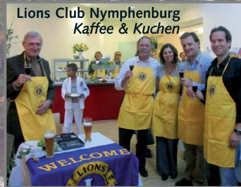
Lions Club Nymphenburg Kaffee & Kuchen