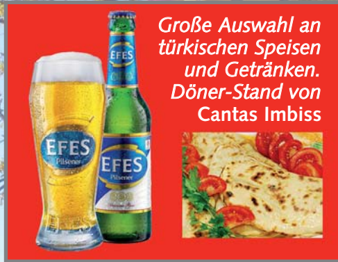
Große Auswahl an türkischen Speisen und Getränken. Döner-Stand von Cantas Imbiss