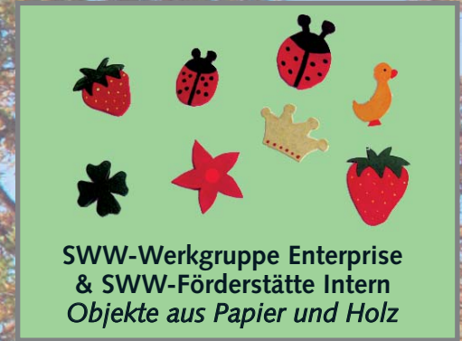
SWW-Werkgruppe Enterprise & SWW-Förderstätte Intern Objekte aus Papier und Holz