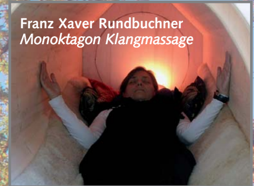
Franz Xaver Rundbuchner Monoktagon Klangmassage