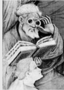
Foto-Ausstellung Brillen im Mittelalter Thomas Schwarz, SWW (Forts. im Obergeschoss)